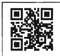
สิ่งที่ส่งมาด้วย ๔

QR Code คู่มือการตรวจสอบ คุณสมบัติ ของเครื่อง