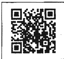
สิ่งที่ส่งมาด้วย ๒

QR Code สำหรับ คอบแบบสอบถาม ช่องทางการ เข้าใช้งานระบบฯ